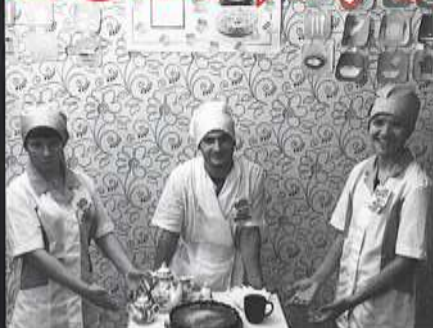
Воспитанники ГКУСО РО «Звёздный центр помощи детям», Ростовская область